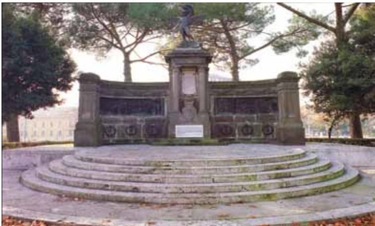
Monumento alla Memoria dei Genieri Caduti, piazza Maresciallo Giardino, Roma.

E' stato inoltre realizzato il sito "www.iscag.it" che, con le sue 1.950 pagine e con le oltre 3.000 fotografie, consente di effettuare una visita virtuale al Museo del Genio ed al Museo dell'Architettura Militare e di accedere agli indici dei 144 Bollettini del Genio prodotti dall'ISCAG dal 1935 al 1983.